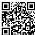
QR-Code App Store

Mit der App "KVB Erstattung" können Sie als Mitglied der Krankenversorgung der Bundesbahnbeamten mobil Erstattungsanträge an die Krankenversorgung und Pflegeversicherung stellen. Die App ist eine einfache und schnelle Alternative zur Einsendung eines Erstattungsantrags auf dem Postweg.