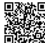
QR-Code Play Store